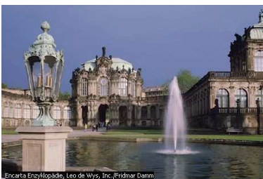
Weltliche Barockarchitektur: Der Dresdner Zwinger wurde zwischen 1711 und 1728 von Matthäus Daniel Pöppelmann (1662-1736) erbaut.

Prachtentfaltung und Luxus standen an den Höfen der katholischen Monarchen an erster Stelle. Das zeigt sich besonders in der Architektur ihrer Schlösser. Diese Bauten dienten in erster Linie der Repräsentation. Da auch die katholische Kirche ihre Macht demonstrieren wollte, entstanden auch barocke Kirchenbauten. Die Gebäude sollten den Besucher vor allem beeindrucken. Deswegen sind Dynamik, Kontrast und eine Vielzahl an Dekorationen Stilmerkmale der barocken Architektur.