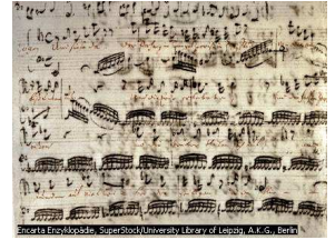
Blatt aus Bachs „Matthäuspassion“

Johann Sebastian Bach (1685-1750) gilt als bedeutendster Vertreter der Barockmusik. Er ist heute einer der bekanntesten Komponisten überhaupt. Bach stammte aus einer Musikerfamilie in Eisenach (Thüringen). Von 1693 bis 1695 besuchte er die Lateinschule in Eisenach, danach wechselte er infolge des Todes seiner Eltern auf das Gymnasium in Ohrdruf (Thüringen). Hier wurde der Musikunterricht, den ihm bis dahin sein Vater erteilt hatte, fortgesetzt. An der Michaelisschule in Lüneburg (Niedersachsen) war er von 1700 bis 1702 Chorknabe.