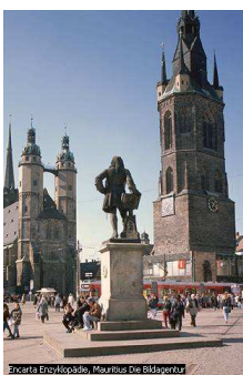
Händel-Denkmal in Halle/Saale (Sachsen-Anhalt)

Georg Friedrich Händel (1685-1759) machte sich vor allem als Schöpfer barocker Vokalmusik (Opern, Oratorien) einen Ruf. Er wurde in seiner Geburtsstadt Halle/Saale musikalisch ausgebildet und war dort 1702 und 1703 Organist. Am Hamburger Opernhaus wurde er 1703 Geiger und Cembalospieler. Hier wurde 1705 seine erste Oper uraufgeführt. Großen Erfolg hatte Händel mit seiner Oper („Agrippina“) in Italien, wo er von 1707 bis 1709 lebte. Nach dem triumphalen Erfolg seiner Oper „Rinaldo“ (1711) in London entschloss sich Händel nach einem kurzen Aufenthalt in Hannover zur Übersiedlung nach England. Er wurde 1727 britischer Staatsbürger und feierte zahlreiche erfolgreiche Operaufführungen, die ihn europaweit bekannt machten. Wegen zunehmender Unbeliebtheit des Operngenres begann er Oratorien zu komponieren, die auf der Tradition der englischen Chormusik aufbauten. Mit dem englischsprachigen Oratorium „Messiah“ („Der Messias“, 1742) wurde Händel der erste deutsche Komponist, der Weltruhm erlangte. Nach seinem Tod wurde Händel unter hohen Ehren in der Westminster Abbey beigesetzt. Weitere Werke: