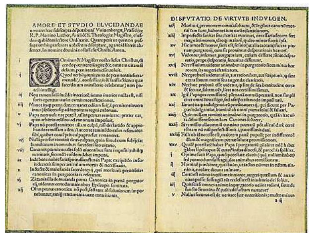
Die 95 Thesen Martin Luthers

Obwohl Luther so zum Wegbereiter des Protestantismus wurde, ist seine 1534 veröffentlichte Bibelübersetzung aus deutscher Sicht noch bedeutender. Sehr geschickt vereinte er verschiedene deutsche Dialekte, indem er seine Übersetzung in der ostsächsischen Kanzleisprache schrieb. Die Luther-Bibel und ihre schnelle Verbreitung im deutschen Sprachraum schufen die Grundlage für eine einheitliche deutsche Literatursprache, die jeder Deutsche verstehen konnte. Damit kennzeichnet Luthers Bibelübersetzung den Beginn einer einheitlichen deutschen Nationalliteratur .