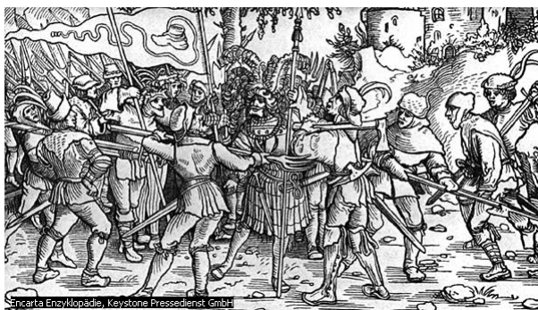
Aufständische Bauern mit der Bundschuhfahne bedrohen einen Ritter

Der Zorn der Armen richtete sich auch gegen die Zustände in der Kirche. Die Zahl der Geistlichen war stark gewachsen. Dadurch brauchte die Kirche immer mehr Geld, das sie durch ständig steigende Abgaben, Bußgelder und den Handel mit Reliquien beschaffte. Zuletzt führte die Kirche den Ablasshandel ein: Die Geistlichen vergaben den Menschen ihre Sünden, wenn sie dafür bezahlten. Für manche Sünden konnte man sogar im Voraus bezahlen.